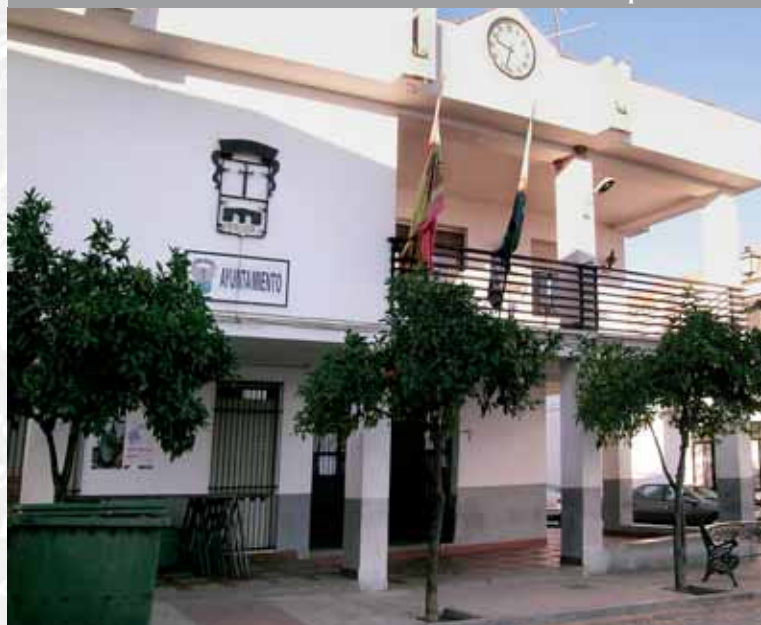
Fachada del Ayuntamiento.