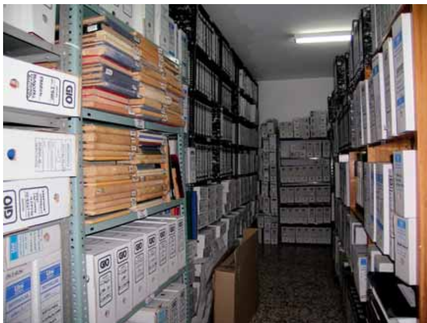
Archivo Municipal de Usagre antes de la elaboración del Inventario.