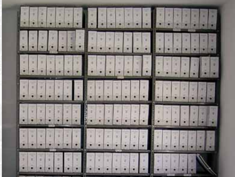
Archivo Municipal de Usagre después de elaborar el Inventario.